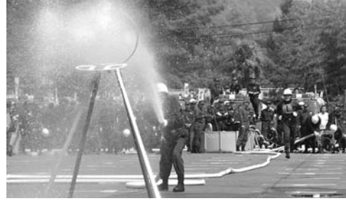
小型動力ポンプの部