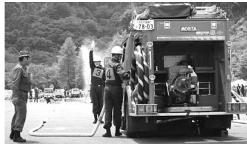
ポンプ自動車の部

厳しい訓練の成果を競います。応援してください。 日時 6月7日(日) 午前9時 会場 東京サマーランド 第2駐車場(雨天決行) 問合せ 地域防災課 防災安全係